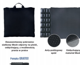
Dwuwarstwowy pokrowiec siatkowy Mesh odporny na pleśń, oddychający, z możliwością prania w pralce