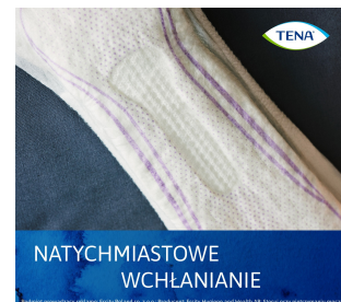
To jest wyrób medyczny. Używaj go zgodnie z instrukcją używania lub etykieta.