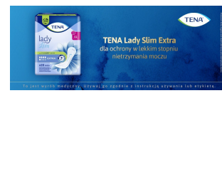
To jest wyrób medyczny. Używaj go zgodnie z instrukcją używania lub etykieta.