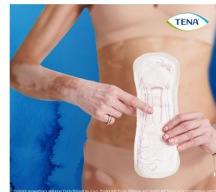
To jest wyrób medyczny. Używaj go zgodnie z instrukcją używania lub etykieta.