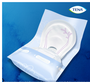
To jest wyrób medyczny. Używaj go zgodnie z instrukcją używania lub etykieta.