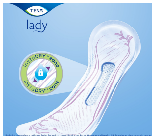
To jest wyrób medyczny. Używaj go zgodnie z instrukcją używania lub etykieta.