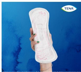
To jest wyrób medyczny. Używaj go zgodnie z instrukcją używania lub etykieta.