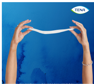
To jest wyrób medyczny. Używaj go zgodnie z instrukcją używania lub etykieta.