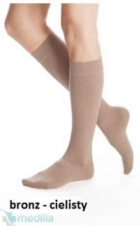
bronz - cielisty